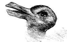
Kaninchen und Ente.

Welche Tiere gleichen ein- ander am meisten?